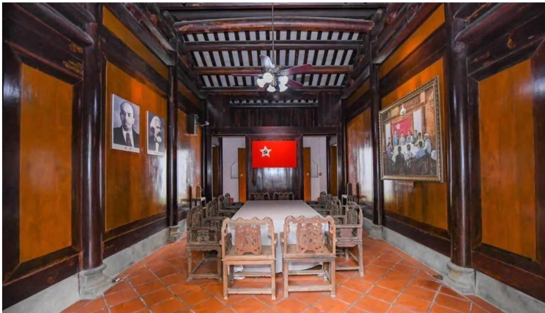
中共琼崖第一次代表大会旧址