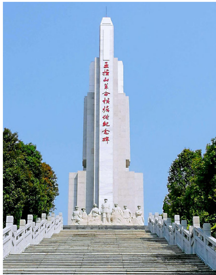
五指山革命根据地纪念馆