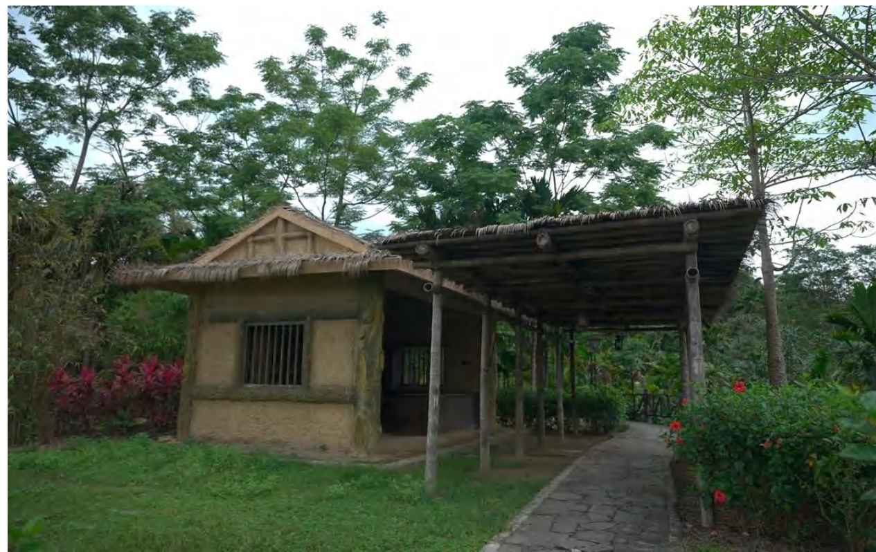
母瑞山革命根据地