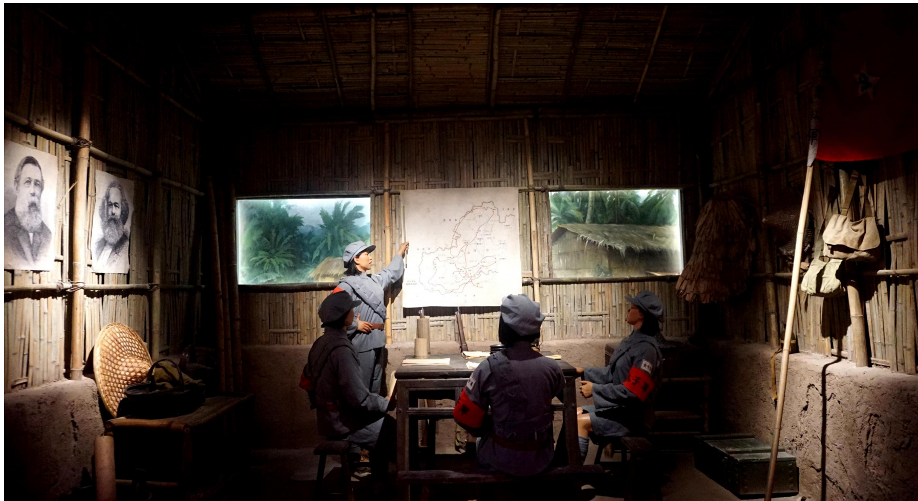
红色娘子军在开会进行战略部署时的场景