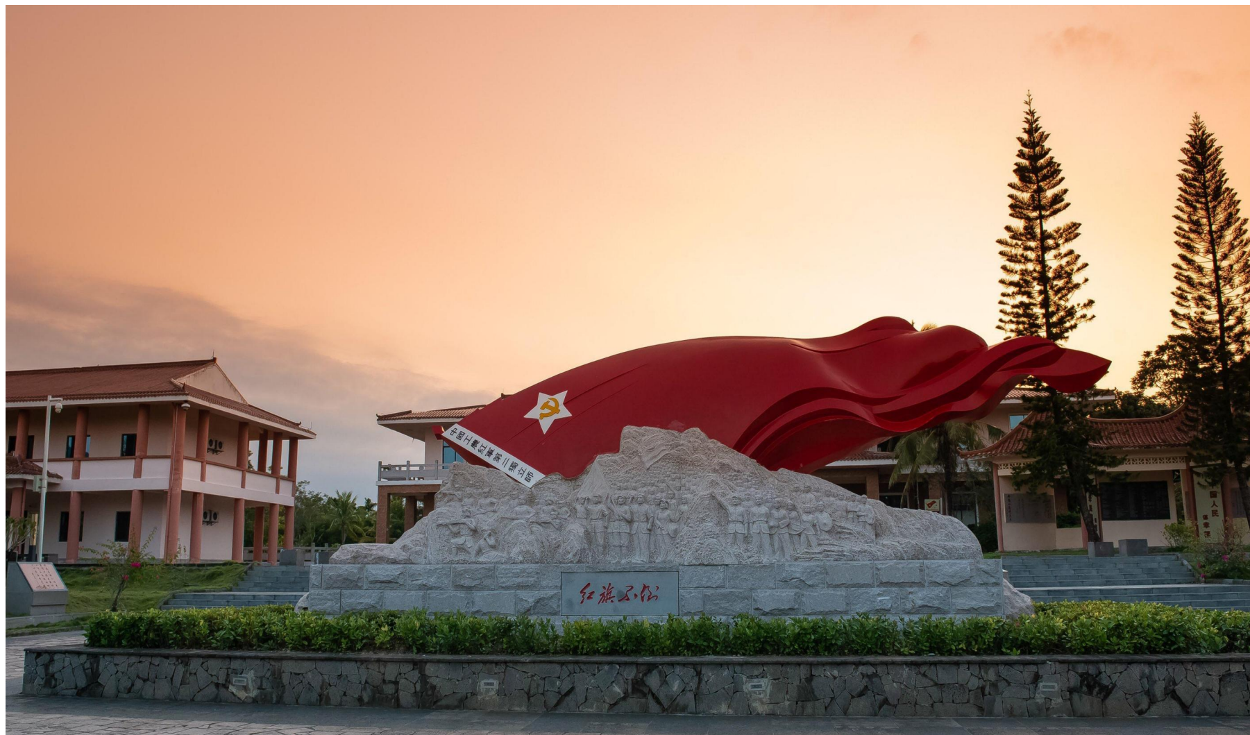
五指山革命根据地纪念园