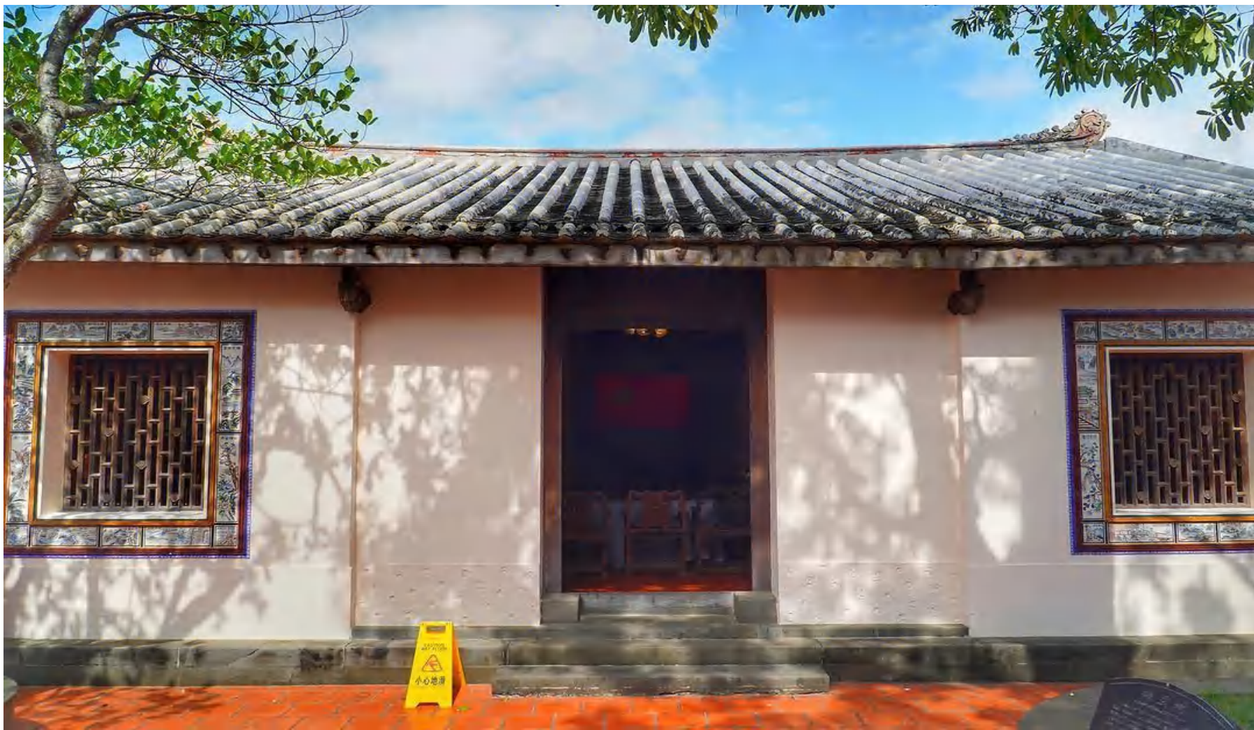
中共琼崖第一次代表大会旧址